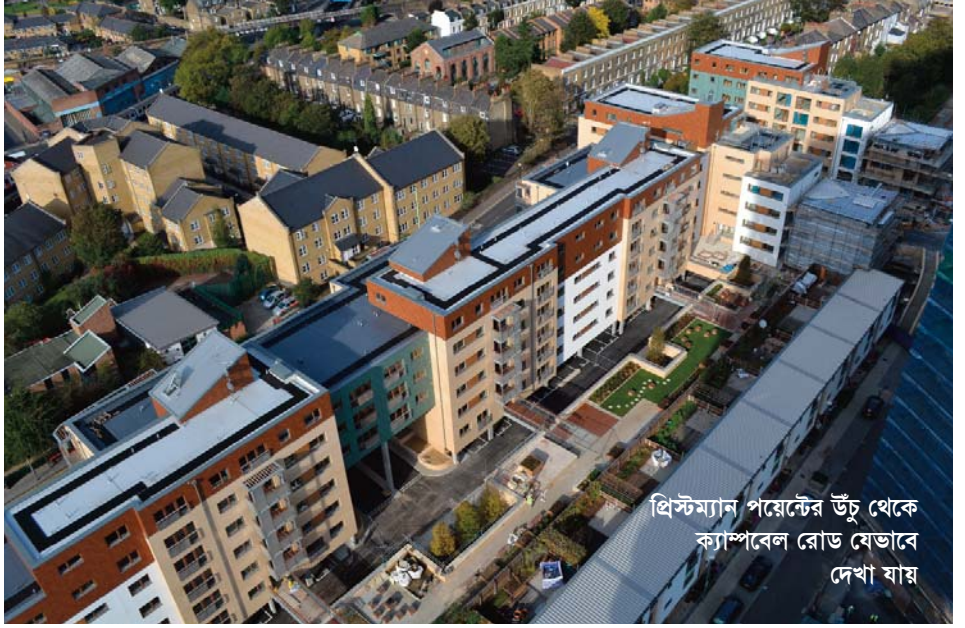
থ্রিস্টম্যান পয়েন্টের উঁচু থেকে ক্যাম্পবেল রোড যেভাবে দেখা যায়

ক্যাম্পবেল রোডের রিজেনারেশন কর্মকান্ড শেষ হয়ে আসছে এবং কান্ট্রিসাইড প্রোপার্টিজ আমাদের কাছে প্রথম ব্লক হস্তান্তর করেছে। বাদবাকী ব্লকগুলি নির্ধারিত সময়ে শেষ হবে এবং আগামী চারমাসের ভেতরে এগুলি হস্তান্তর করা হবে।