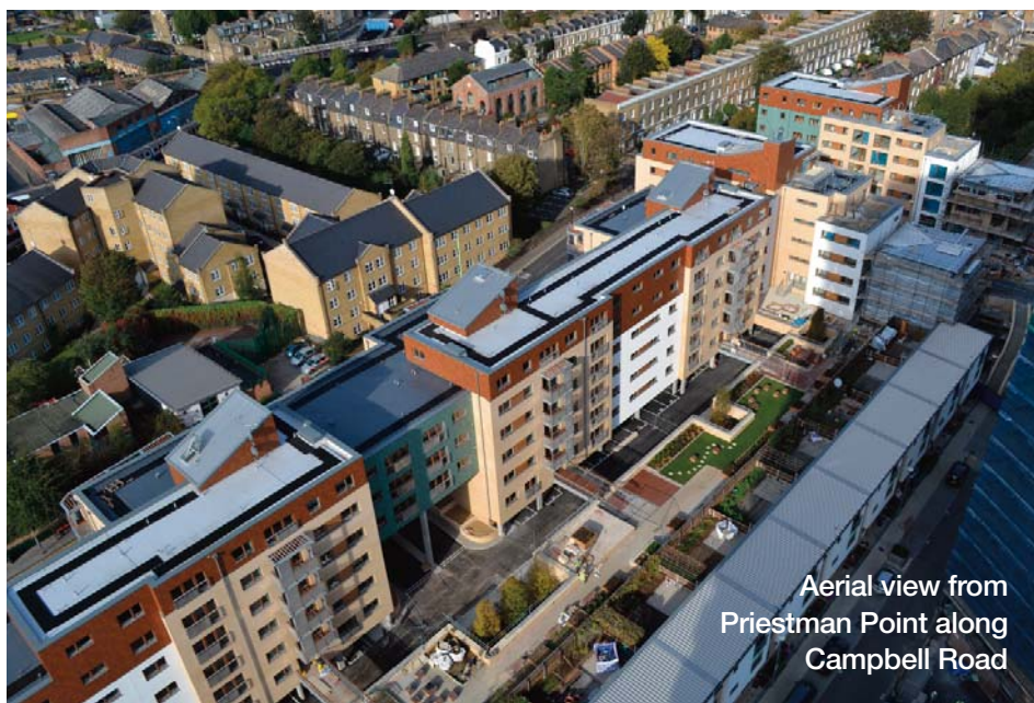
Aerial view from Priestman Point along Campbell Road

The regeneration works along Campbell Road are coming to an end and Countryside Properties have now handed over the first blocks to us. The remaining blocks are all due to be completed and handed over in the next four months.